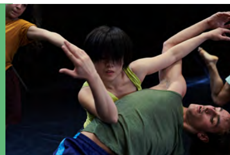
Teaser de la méthode Practice

Ces cinq fondamentaux permettent d'élargir le potentiel physique et créatif des danseurs. Ils donnent des outils pour pouvoir vivre le mouvement en temps réel et partager son expressivité avec les autres. Practice enrichit la virtuosité grâce à des exercices précis et à l'improvisation guidée par des images ludiques et organiques.